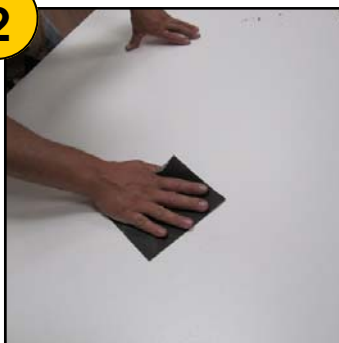
Egrenage au papier de verre fin