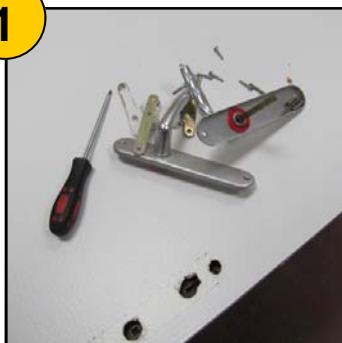
Démontage ferrures et accessoires