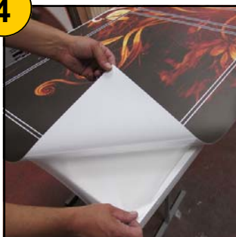
Dépose du film au verso