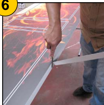
Découpe des débords au cutter