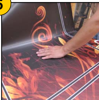
Pose en marouflant à la main ( propre! )

Ne pas hésiter à décoller pour reposer en cas d'imperfections.